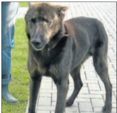
Sorgentier Cesar sucht ein neues Zuhause.